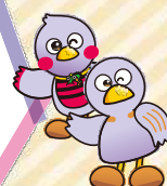
埼玉県マスコット 「コバトン・さいたまっちゃん」