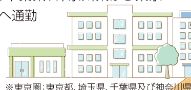
※東京圏：東京都、埼玉県、千葉県及び神奈川県